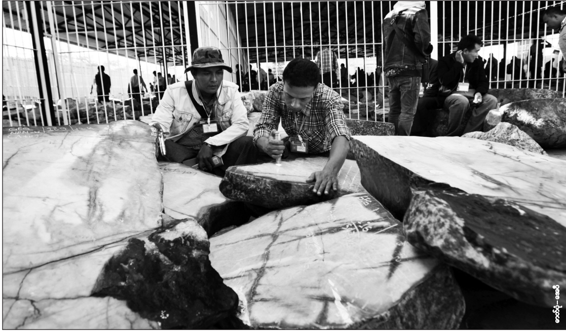
ကျောက်စိမ်းအရောင်းပြပွဲတွေနဲ့ ကျောက်စိမ်းတူးဖော်မှုတွေကနေ ရရှိတဲ့အခွန်ငွေက ပြည်ထောင်စုအခွန်ရရှိမှုငွေအားလုံးရဲ့ သုံးပုံတစ်ပုံခန့်အထိ ရှိနေပါတယ်။

ရန်ကင်း၊ ဒီဇင်ဘာ ၁၃ - ကျောက်စိမ်းသယ်ယူပို့ဆောင်ရေးကုမ္ပဏီများက နေရာဒေသခံအခွန်နှင့် အခွန်ငွေတွေ ဆုံးရှုံးနေမှုက အစိုးရသစ်တို့ တွယ်ရမယ့် ပြဿနာတစ်ခု ဖြစ်နေပါသည်။